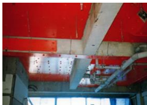
梁補強・スラブ補強